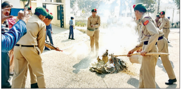
खरखौदा। फायर फाइटिंग ड्रिल का अभ्यास करते विद्यार्थी।

विद्यार्थियों की सुरक्षा को ध्यान में रखते आग से बचाव का अभ्यास किया गया। इस अभ्यास का मुख्य उद्देश्य विद्यार्थियों को आग लगने जैसी आपातकालीन परिस्थितियों में घबराए बिना सुरक्षित ढंग से बाहर निकलने, स्वयं की रक्षा करने तथा अन्य लोगों की सहायता करने के लिए आवश्यक व्यावहारिक ज्ञान एवं प्रशिक्षण प्रदान करना था। इस कार्यक्रम के दौरान विद्यार्थियों को आग लगने के कारण, उससे बचाव के उपाय, सुरक्षित निकासी के रास्ते, प्राथमिक सावधानियां तथा आपात स्थिति में संयम बनाए रखने जैसे महत्वपूर्ण विषयों की जानकारी दी गई। फायर फाइटिंग