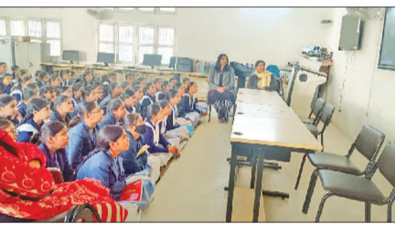
सोनीपत। मुख्यालय अट्ठा स्थित पीएमश्री का कान्वा स्कूल में प्रसारण देखती छात्राएं।

परीक्षा पर चर्चा कार्यक्रम के तहत प्रधानमंत्री नरेंद्र मोदी ने विद्यार्थियों, शिक्षकों व अभिभावकों से चर्चा करते हुए वार्षिक परीक्षाओं के तनाव को दूर किया। सोनीपत के विभिन्न स्कूलों में परीक्षा पर चर्चा कार्यक्रम को कक्षा छठी से 12वीं कक्षा तक के विद्यार्थियों को लाइव दिखाया गया। इसके लिए पहले ही सभी स्कूलों में तैयारियां पूरी कर ली गई थी। मुख्यालय अट्ठा स्थित पीएमश्री राजकीय कान्वा वरिष्ठ माध्यमिक विद्यालय में आगामी परीक्षाओं के