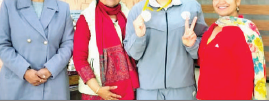
सोनीपत। विजेता विद्यार्थी के साथ प्राचार्या एवं कॉलेज स्टाफ।