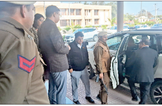
खरखौदा। वार्ता के उपरान्त खरखौदा से लौटते उपायुक्त।