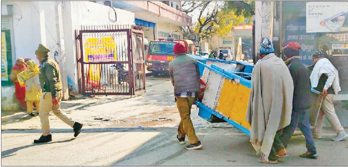
सोनीपत। रेलवे रोड पर अतिक्रमण हटाओ अभियान के दौरान रेहड़ियों का सामान उठाकर निगम कार्यालय के स्टोर में ले जाते कर्मचारी।

नगर निगम की ओर से शुक्रवार को शहर के रेलवे रोड पर अतिक्रमण हटाओ अभियान चलाकर अवैध कब्जा करने वालों के खिलाफ सख्त कार्रवाई की। अभियान के दौरान निगम अधिकारियों व कर्मचारियों की टीम के साथ पुलिस बल भी मौजूद रहा। इस दौरान कर्मचारियों ने सड़क किनारे अवैध रूप से लगने वाली रेहड़ियों व दुकानों के बाहर रखे सामान को हटवाया। हालांकि नगर निगम की ओर से कार्रवाई के लिए एक दिन पहले दुकानदारों व रेहड़ी संचालकों को अतिक्रमण हटाने की हिदायत दी गई थी। शुक्रवार को न मानने वाले रेहड़ी संचालकों का सामान जब्त कर लिया गया। निगम कर्मचारियों को देख कई दुकानदार अपने सामान को अंदर करते नजर आए तो वहीं कई रेहड़ी संचालकों ने दिनभर अपनी रेहड़ी नहीं लगवाईं। जिन रेहड़ी संचालकों ने निगम की हिदायत की अवहेलना की, उनका सामान जब्त कर लिया गया। जिससे उन्हें आर्थिक नुकसान झेलना पड़ा। निगम की इस कार्रवाई का रेहड़ी संचालकों व दुकानदारों ने विरोध किया, लेकिन