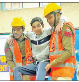
सोनीपत। जानकारी देते प्रशिक्षक।

ऋषिकुल विद्यापीठ, सोनीपत में विद्यार्थियों एवं स्टाफ की सुरक्षा और जागरूकता को ध्यान में रखते हुए हरियाणा स्टेट डिजास्टर रिस्पॉन्स फोर्स द्वारा एक विशेष आपदा प्रबंधन जागरूकता एवं प्रशिक्षण कार्यक्रम का आयोजन किया गया। इस कार्यक्रम का मुख्य उद्देश्य विद्यार्थियों को प्राकृतिक एवं मानव-निर्मित आपदाओं के दौरान सुरक्षित रहने और दूसरों की सहायता करने के तरीकों से अवगत कराना था। इस अवसर पर