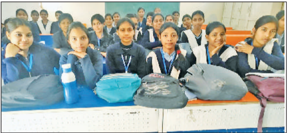
सोनीपत। सोनीपत के मुरथल अड्डा स्थित पीएमश्री राजकीय कन्या विद्यालय में कक्षा में पढ़ाई करती छात्राएं।